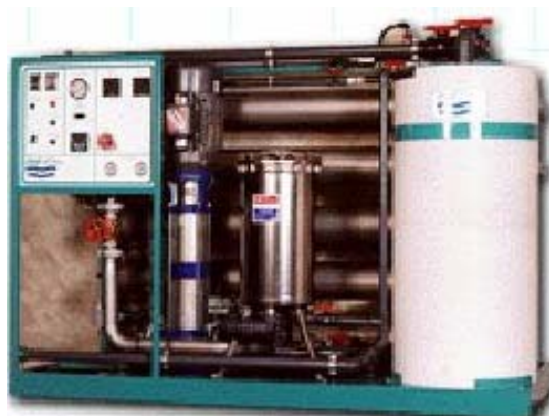
Eau potable par filtration membranaire