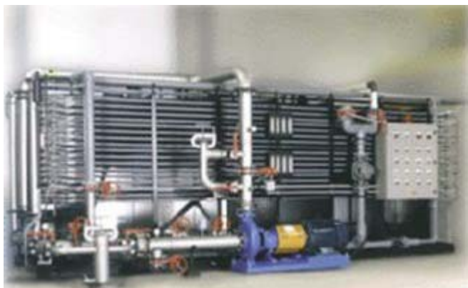
Dessalement eau de mer par osmose inverse

Les recherches récentes, menées dans le cadre des diverses collaborations internationales du CEA, indiquent que, grâce aux techniques innovantes, le coût du dessalement effectué à partir de réacteurs nucléaires serait 30 à 60 % inférieur à celui du dessalement obtenu à partir des sources d'énergie d'origine fossile.